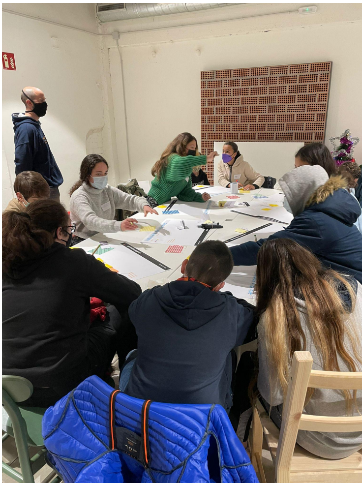
Imatge 1 | Es plantegen les preguntes