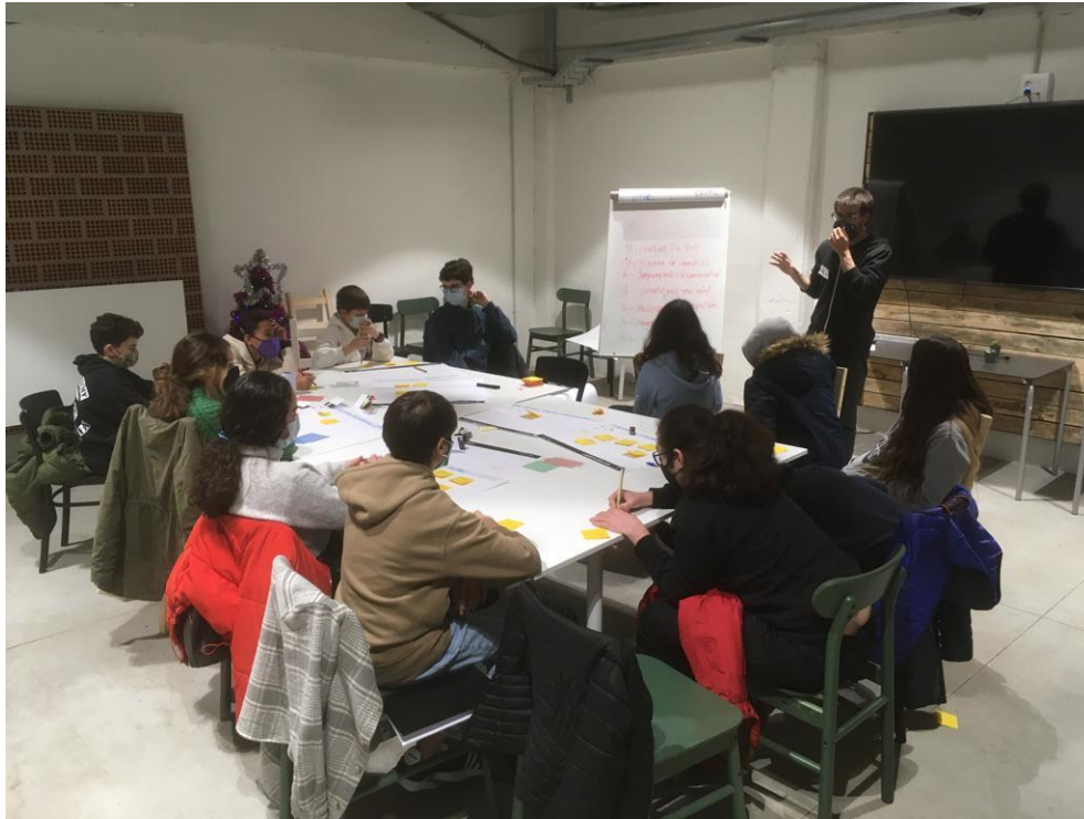
Imatge 2 | Aportant les diferents propostes que interessin als Consellers i Conselleres

Per resumir totes les propostes que han sortit, s'ha preguntat quins eren els teme que han despertat més interès per treballar i els han resumit en 4 grans temes: