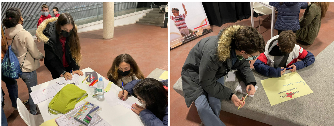
Imatge 1 i 2 | Apuntat el diferents temes que són d'interès per part dels Consellers i les Conselleres