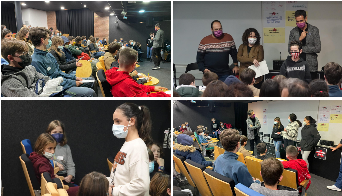
Imatge 3, 4, 5 i 6 | Diferents imatges de la trobada amb l'alcalde

S'ha parlat amb ell i se l'hi ha pogut explicar totes les propostes. Ha demanat de seguir mantenint el contacte més continuat durant el curs i que desenvolupem alguna de les propostes que es plantegen detalladament.